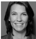
Rita Schwarzelühr- Sutter